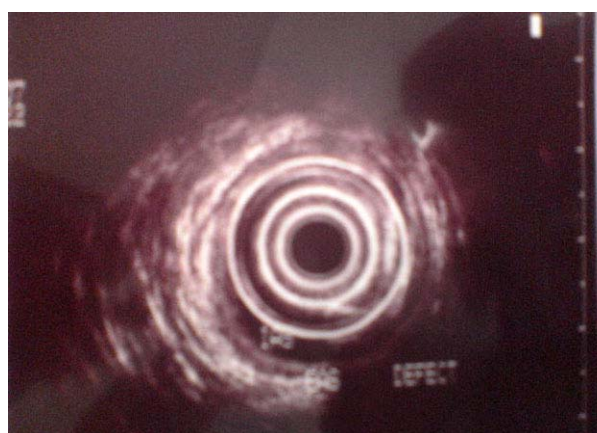
تصویر شماره ۲- جابجایی ناقص رکتوم به علت نقص اسفنکتر مقعد در سونوگرافی اندوانال

درمان جابجایی کامل یا جدا بودن اسفنکتر از آنورکتوم (Complete mislocation) با قرار دادن رکتوم در میان عضله اسفنکتر (Relocation) انجام پذیراست. این روش درمانی برای اولین بار توسط Alberto Pena گزارش شده است. (۳و۲) در نوع Partial mislocation، درمان بی‌اختیاری با ترمیم عضله اسفنکتر مقعد میسر می‌گردد. تعیبه کلتومی به مدت یک ماه در هر دو حالت توصیه می‌شود.