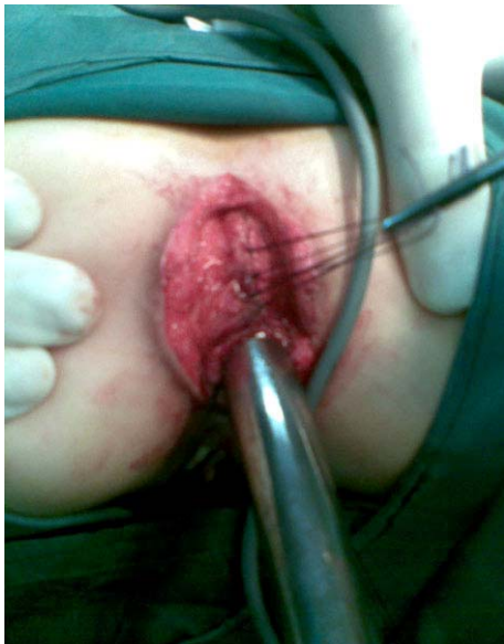
تصویر شماره ۵- جابجایی ناقص رکتوم به علت نقص اسفنکتر مقعد پس از ترمیم

حلقوی در ساعت ۹ دیده شد. معمولاً آخرین بررسی بیماران در زیر بیهوشی با Muscle stimulator (تصویر شماره ۵) بوده و در ۲ مورد اسفنکتر مقعد، خارج از دهانه رکتوم و در کنار آن (Complete mislocation) قرار داشت (تصویر شماره ۳). نقص حلقوی اسفنکتر مقعد در ۵ مورد در ساعت ۱۲ (تصویر شماره ۴)، در ۲ بیمار در ساعت ۱، ۶ مورد در ساعت ۳ و در یک بیمار در ساعت ۹ مشاهده گردید (جدول شماره ۱).