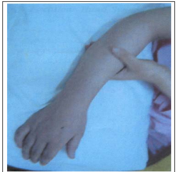
تصویر شماره ۶- بعد از برطرف شدن ادم