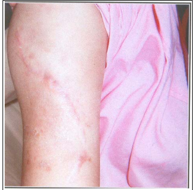
تصویر شماره ۵- دو عدد اسکار Constriction Band در پروگزیمال بازو

در مرحله بعد تصمیم گرفته شد تا مشاوره با روان‌پزشک صورت گیرد که این مسئله با مقاومت شدید همسر بیمار روبرو شد و بیمار با رضایت شخصی از بیمارستان مرخص گردید.