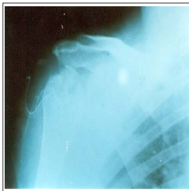
تصویر شماره ۱- رادیوگرافی شانه ضایعات وسیع تخریبی و استئوپوروزیس در سر استخوان بازو (مورد اول)

PPD+=۱۹ میلی‌متر وجود داشت و سایر آزمایش‌ها طبیعی بودند.