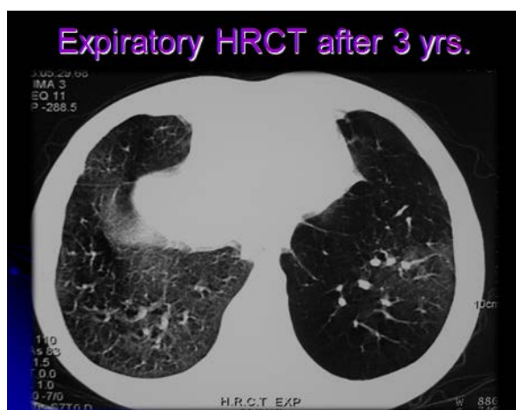
تصویر ۱ - سی‌تی اسکن ریه راست، سه سال بعد از پیوند، وضعیت پارانشیمی خوبی دارد.

راست دارای ۸۴٪ پرفیوژن و ۷۴٪ ونتیلیاسیون بود در حالی که این نسبت در ریه چپ ۱۶٪ و ۲۶٪ بود. بتدریج این تنگی نفس بیشتر شده و درمان‌های معمولی مؤثر نبوده است. در تاریخ ۹۰/۰۱/۲۰ (۵ سال بعد از پیوند) سی‌تی اسکن و رادیوگرافی بیمار مطابق تصویر ۲ ارائه شده است که ریه راست به طور قابل توجهی کاهش حجم یافته و ریه غیر پیوندی با افزایش حجم به طرف مقابل رانده شده. در این وضع در برونکوسکوپی و نمونه‌گیری از ترشحات برونش‌ها و نیز نمونه‌گیری از بافت ریه با برونکوسکوپی، علائمی از عفونت دیده نشده ولی گزارش پاتولوژی دال بر فیبروز ارگانیزه شده در ریه پیوند شده بود و نیز ظرفیتهای تنفسی تا حدود ۲۵٪ کاهش پیدا کرده و در اسکن ونتیلیاسیون / پرفیوژن ریه راست ۵۶٪ پرفیوژن و ۵۴٪ ونتیلیاسیون را داشت. با توجه به تنگی نفس شدید در این زمان تصمیم به پیوند مجدد ریه گرفته شد. بیمار در تاریخ ۹۰/۸/۲۶ تحت عمل پیوند ریه چپ (ریه‌ای که قبلاً پیوند نشده بود) قرار گرفت بعد از انجام پیوند تا پنج روز وضعیت بیمار رو به بهبود رفت و حتی اکستوب شده به تنفس عادی برگشت. متأسفانه در روز پنجم بعد از پیوند مجدد دچار حمله تاکی کاردی و تاکی پنه شدید شد که علیرغم انجام اقدامات حمایتی سریع، بهبودی در وضعیت بیمار حاصل نشد و فوت کرد. به علت امتناع همراهان بیمار از اتوپسی تشخیصی، علت قطعی این تغییر وضعیت ناگهانی بیمار معلوم نشد، ولی بر اساس شواهد بالینی و پاراکلینیکی علت مرگ بیمار آمبولی وسیع ریوی بود.