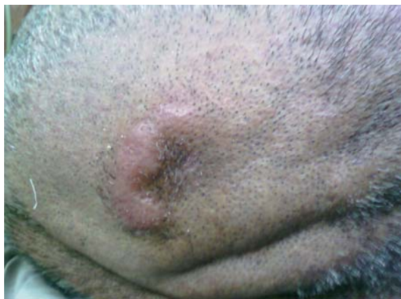
تصویر ۱- ضایعه پوستی پوست سر

در پی‌وپسی از ضایعات پوستی به عمل آمده پرولیفراسیون نوپلاستیک سلول‌های اپی‌تلیال غددی با نمای گlandولر دیده می‌شود، که این سلول‌ها دارای آتیسیم و پلئومورفیسم می‌باشد.