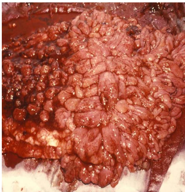
تصویر ۱ - پولیپوز معده

قلب سوپل سیستولیک درجه ۲ سمع شد. در معاینه شکم، تندرست اپی‌گاستر و اطراف ناف داشت. آسیت و دیستانسیون شکم نداشتند سایر معاینات طبیعی بود. در آزمایشات WBC=4900 ، PLT=665000 ، RBC=2/6 میلیون، هموگلوبین 3/9 g/dl، هماتوکریت 14/4\% با MCV=55 ، MCHC=27 داشت. در لام خون محیطی آنیزوسیتوز +3 ، پوئی کیلوسیتوز +2 و گلبول‌های قرمز هایپوکروم میکروستیک دیده شد. خون مخفی در مدفوع نوبت اول ناچیز و در نوبت‌های دوم و سوم، منفی بود. در ترانزیت روده باریک ماده حاجب در زمان طبیعی به درجه ایلئوسکال رسید. نقص‌های کوچکی در معده دیده شد، روده باریک طبیعی بود. در آندوسکوپی از ابتدای کاردیا تا قسمت سوم دئودنوم پوشیده از هزاران پولیپ غیر زخمی بدون پایه و پایه‌دار به اندازه 2/2 تا 2 سانتیمتر دیده شد. در بعضی نقاط منظره‌ای شبیه خوشه انگور جلب توجه می‌کرد. بزرگترین پولیپ حدود 2 سانتیمتر و پایه‌دار در بخش دوم دئودنوم دیده شد. در کولونوسکوپی هموروئید خارجی و یک پولیپ 5 \times 6 میلی‌متر بدون پایه در 18 سانتی‌متری و پولیپ پایه‌دار دیگری در فاصله 8 سانتی‌متری از آنال ورج دیده شد. در زاویه طحالی نیز پولیپی به ابعاد 5 \times 5 میلی‌متر مشاهده گردید. کولون عرضی و صعودی پولیپ نداشت از پولیپ‌های موجود بیوپسی تهیه شد. در نتیجه پاتولوژی، تمامی پولیپ‌ها از نوع هایپرپلاستیک و بدون شواهدی از بدخیمی گزارش شد (تصویر ۱).