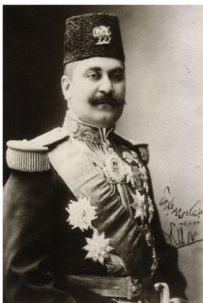
تصویری از صمدخان ممتازالسلطنه

۳- اعلان رسمی در باب قدغن بودن استعمال گلوله‌هایی که در بدن انسان به آسانی متلاشی و پهن می‌شود و کذالک گلوله‌هایی که لفافه اش ضخیم است... این قرارنامه‌ها و اعلانات رسمیه را بعد از غوررسی و تحقیق و تدقیق، قبول و ممضی داشتیم. چنان که به موجب این سطور آنها را تماماً ممضی و مجری می‌دانم و از طرف خودمان و ولیعهد و خلف خودمان قول می‌دهم که تمام فصول و مضامین این قرارنامه‌ها و اعلانات رسمیه بدون تخلف مجری خواهد شود به موجب این قبولی به دستخط خودمان این نوشته را امضا نموده و بنویسیم به مهر دولتی ممهور شود.