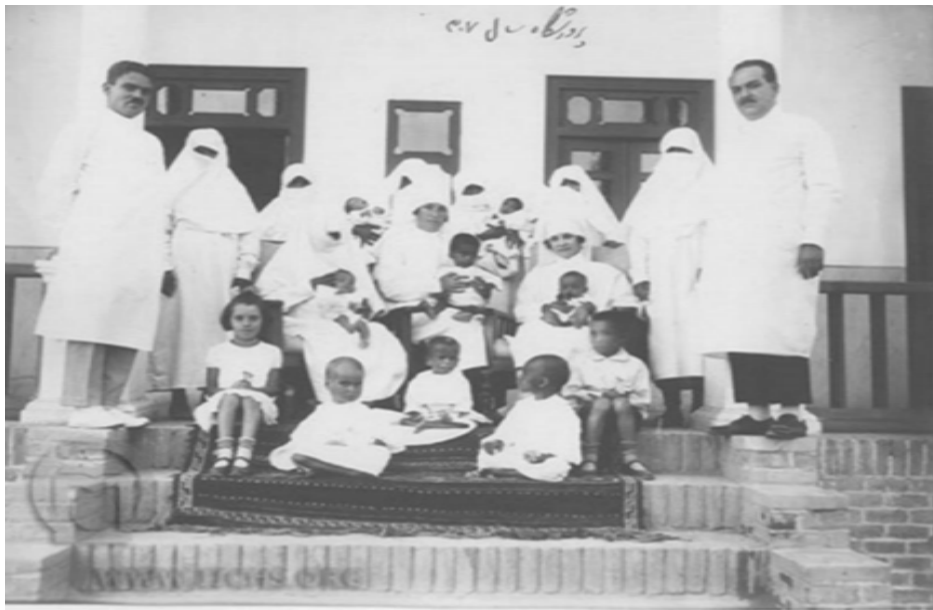
پرورشگاه شیر و خورشید مشهد ۱۳۰۷