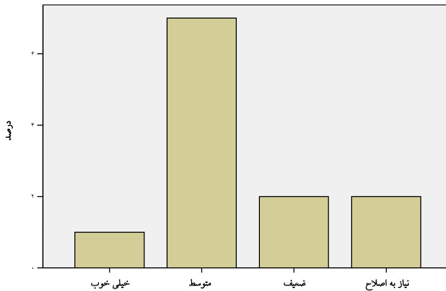
نمودار ۳: فراوانی نسبی رضایت دانشجویان از همکاری پرسنل درمانی در کارورزی عرصه