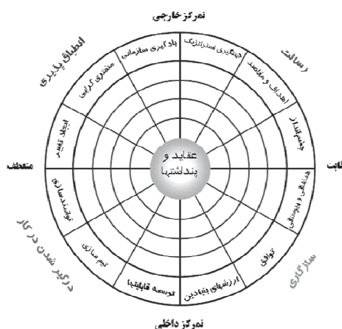
شکل ۱: مدل فرهنگ سازمانی دنیسون

به سبب ماهیت پیچیده فرهنگ سازمانی، نظریه و چارچوب یکسانی برای بررسی و شناسایی آن وجود ندارد. [۹] با وجود این، یکی از جدیدترین و رایج‌ترین مدل‌های شناسایی و اندازه‌گیری فرهنگ سازمانی، مدل فرهنگ سازمانی دنیسون است که امروزه بسیاری از سازمان‌ها برای شناخت ضعف‌ها و قوت‌های فرهنگ سازمانی خود و توسعه آن به این مدل روی آورده‌اند. بیشتر پژوهش‌هایی که بر پایه‌ی این مدل در خارج از کشور انجام گرفته است، بر اهمیت آن در بهبود اثر بخشی و عملکرد سازمان‌ها تأکید دارد. با توجه به جدید بودن این مدل، تاکنون در بیمارستان‌ها و سازمان‌های بهداشتی و درمانی کشورمان از این مدل استفاده نشده است. در نتیجه با توجه به نقشی که فرهنگ سازمانی در اثربخشی و عملکرد مطلوب بیمارستان‌ها دارد، در پژوهش حاضر به مطالعه فرهنگ سازمانی بیمارستان شهیدهاشمی نژاد تهران بر اساس مدل دنیسون پرداخته شده است. دنیسون، پروفیسور رفتار سازمانی دانشگاه